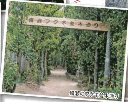
備瀬のフクギ並木通り