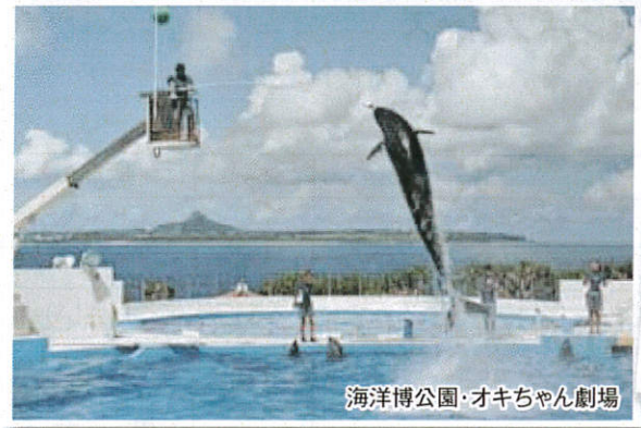
海洋博公園・オキちゃん劇場