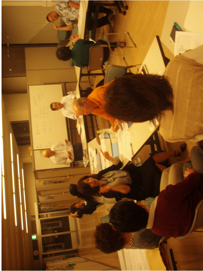
4 / 1 2 第 9 回 目 実行委員会の様子